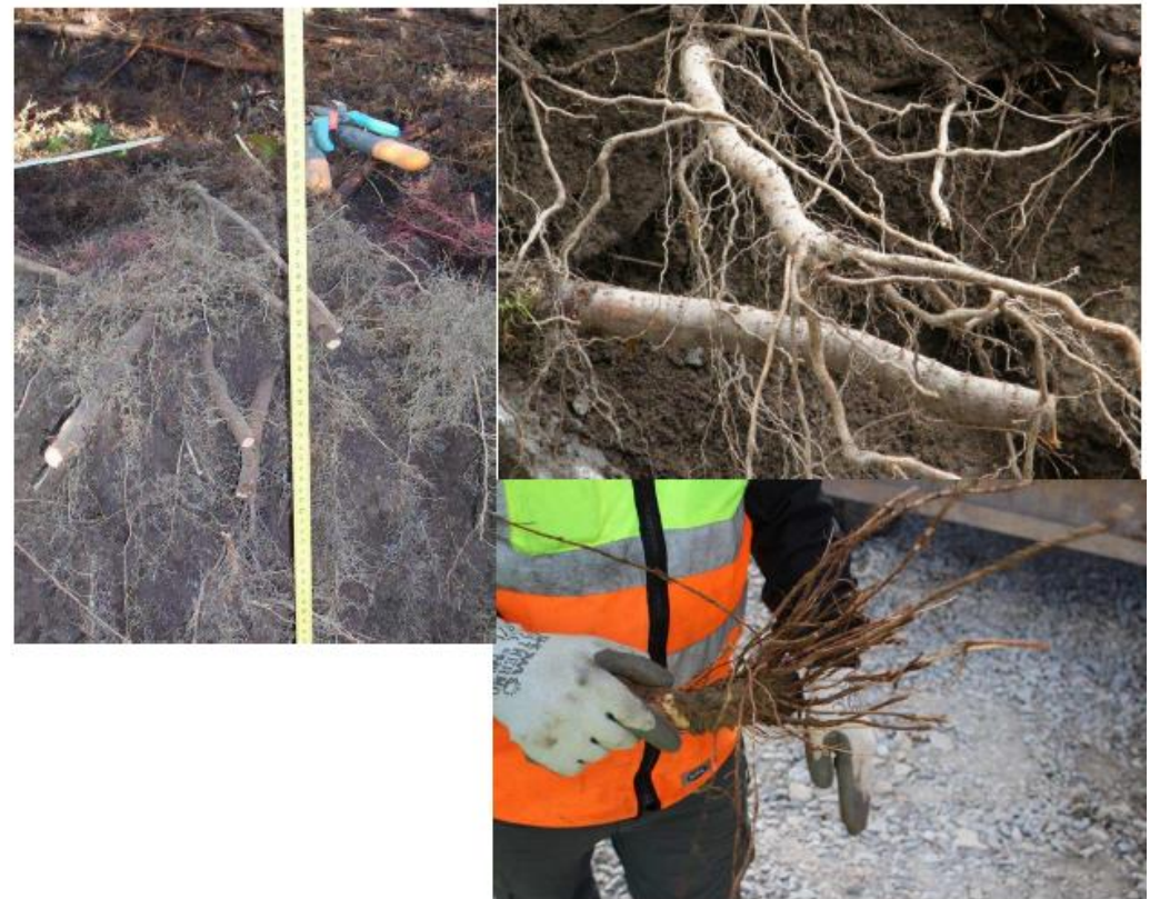
Massiv rotutveckling 2 år efter beskärning