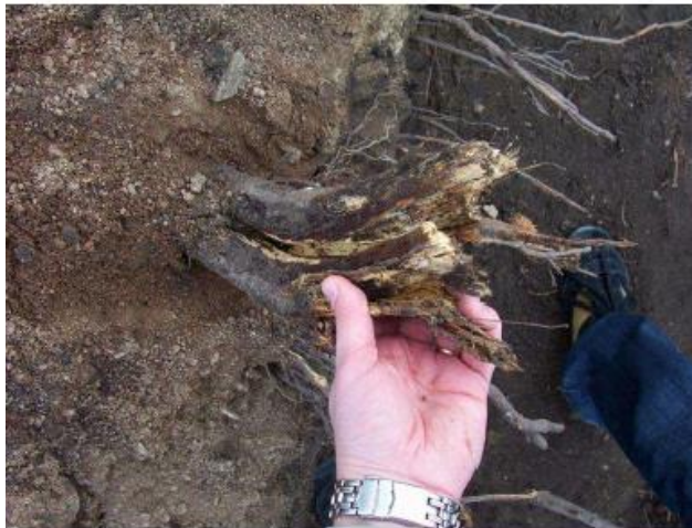
Stor fläk skadad rot beskärs med ett rent snitt.