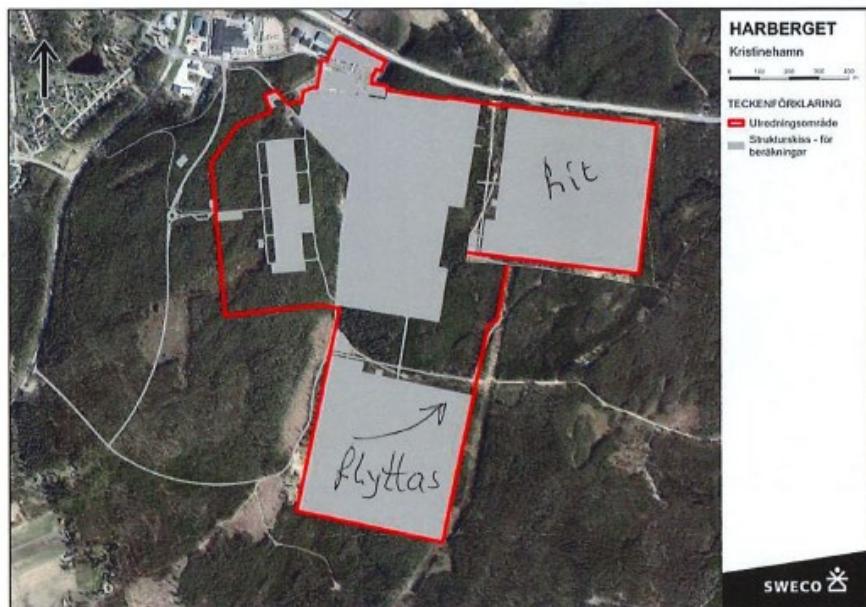
Bild: Ytor inom utredningsområdet som beräknas hårdgöras. Dagvattenutredning A9, Harberget Kristinehamn Fortifikationsverket, Sweco 2023-08-29.